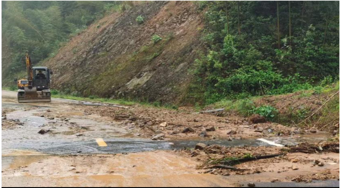
专业机械设备道路清障