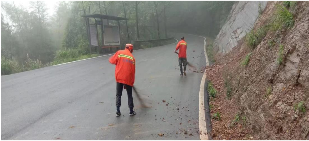
铲除清理道路路障