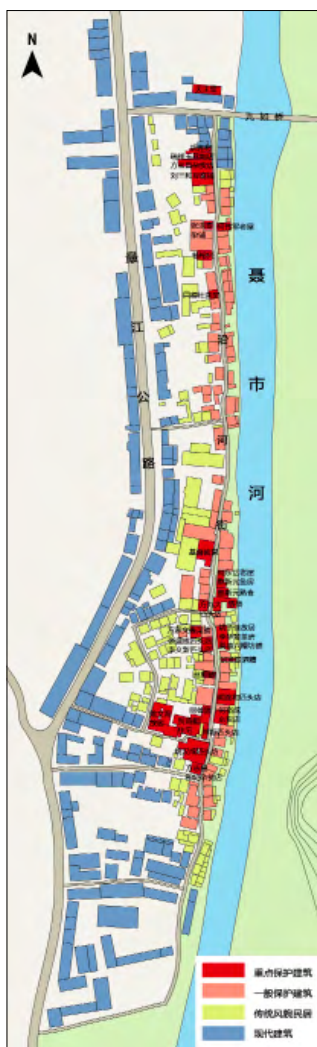
聂市古镇总平面图

抬故事，是一种古老的民间表演形式，一般选择10岁以下儿童作为表演者，站在特质的故事棚架上展示故事中的人物形象，人们可以根据人物造型及装扮，猜出其中的故事内容。在聂市，最为热闹的是上、下街比赛抬故事。上、下街的一方先扎好一抬故事，由少数人簇拥着，敲锣打鼓抬到对方范围内游行一周后返回，如果对方半天不应战，又扎1~2抬