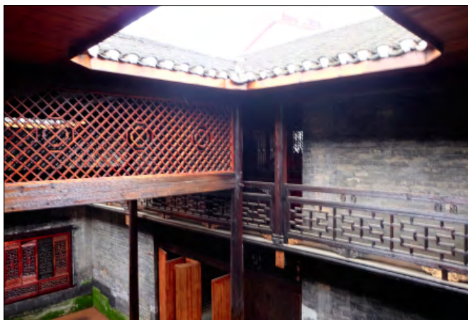
姚文海旧居湿天井