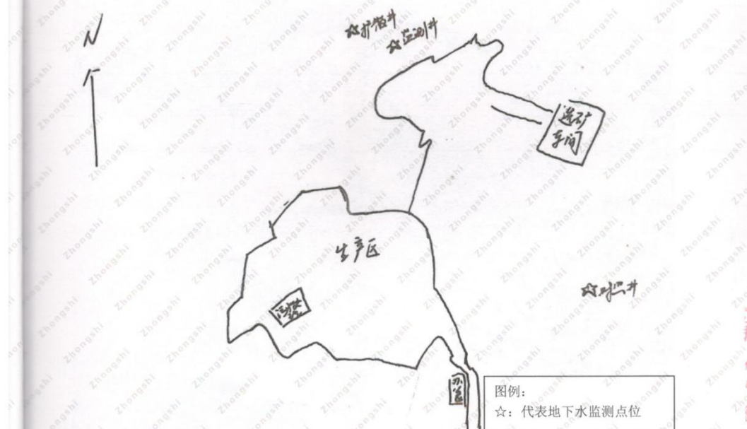
附图1 检测点位示意图